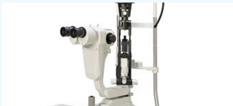
T. C. UŞAK VALİLİĞİ

* Hayırsever Sevim Erdem tarafından alınarak hastanemiz göz polikliniğine hibe edilen 1 adet Biyomikroskop , 1 adet Motorize Sehpa, 2 adet Chart Projektör, 3 adet Masa Setinin kurulumu yapılarak Göz Poliklinik odası hizmete açıldı.